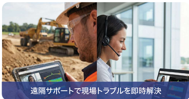
遠隔サポートで現場トラブルを即時解決

高精度なRTK測位を実現するNtripA 3 サービスの運用、管理を一括して行うことができます。