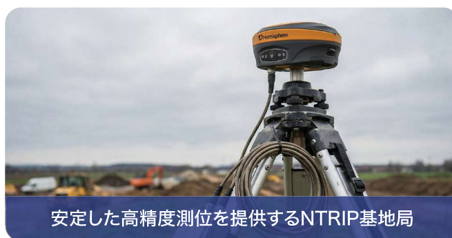
安定した高精度測位を提供するNTRIP基地局